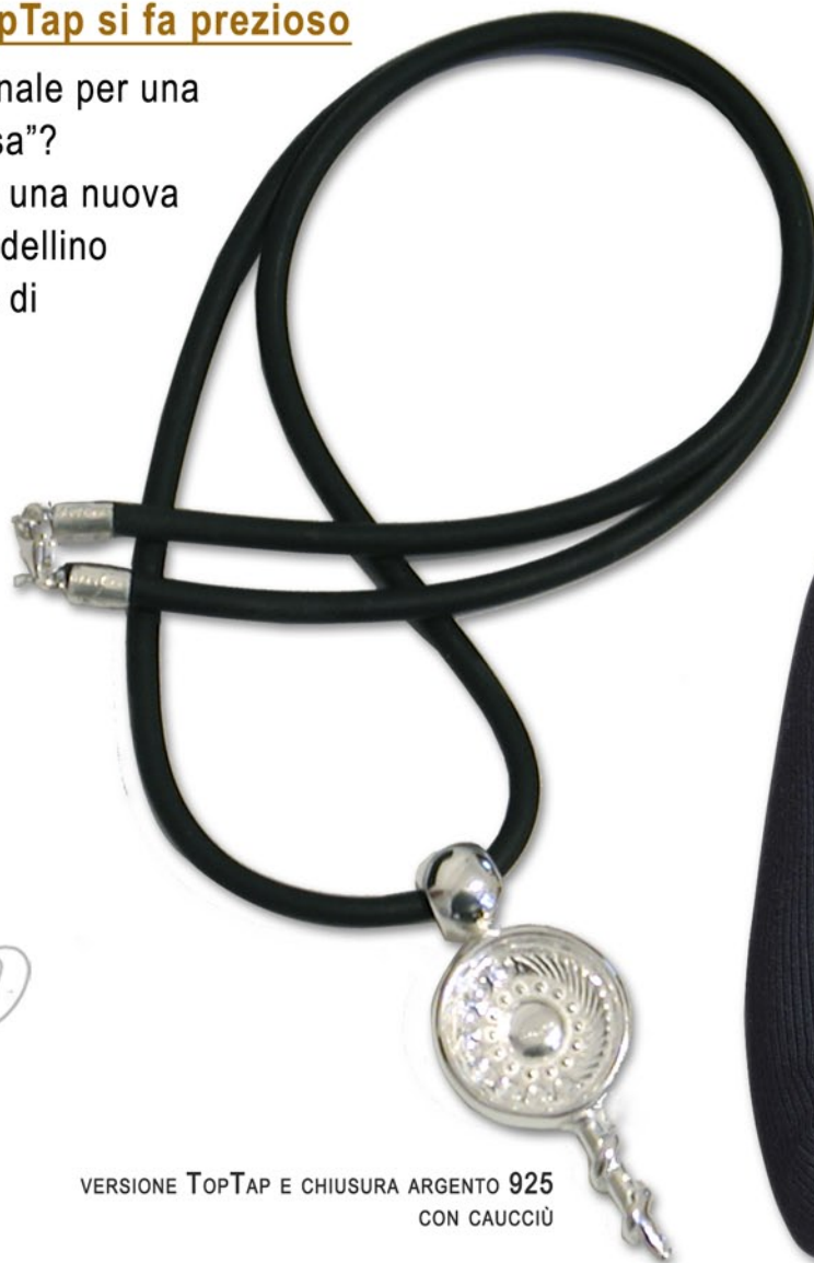
VERSIONE TOPTAP E CHIUSURA ARGENTO 925 CON CAUCCIÙ