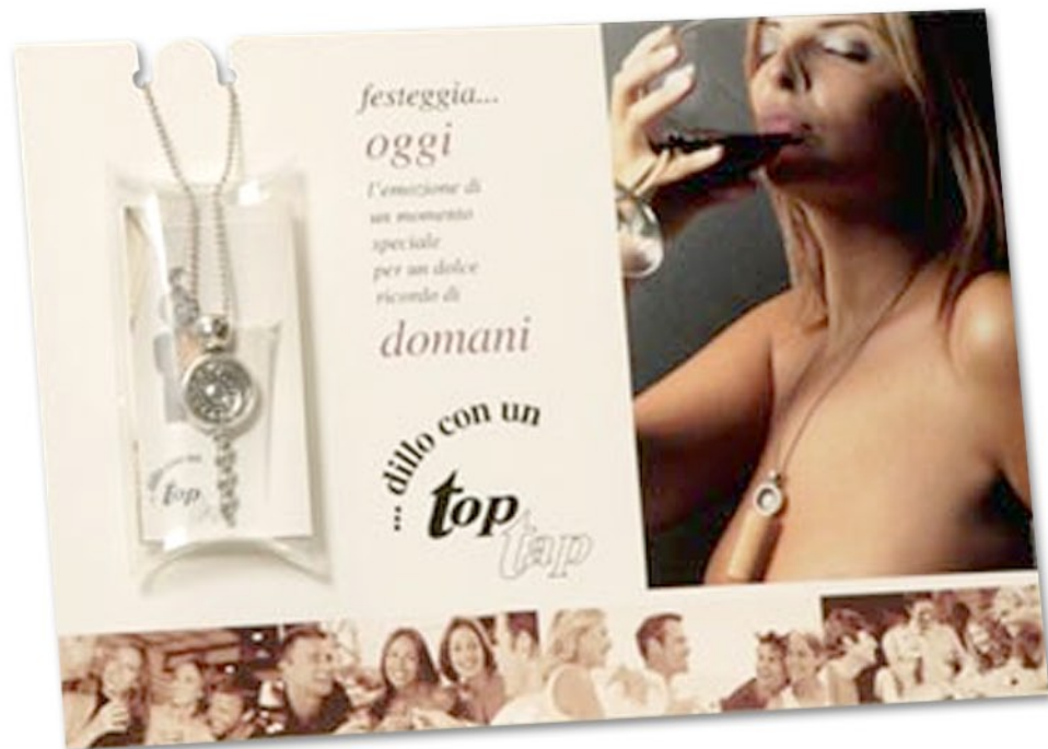
ESPOSITORE DA BANCO CON TOP TAP CONFEZIONATO PER IL PUBBLICO