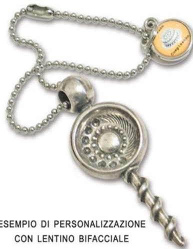
ESEMPIO DI PERSONALIZZAZIONE CON LENTINO BIFACCIALE

TopTap può essere infatti personalizzato secondo diverse modalità: si possono aggiungere lentini (vedi foto sotto) con al verso il logo aziendale e al recto l'immagine dell'evento da ricordare (matrimoni, compleanni, laurea, addio al celibato, anno nuovo, natale... etc.); aggiungere un piccolo tassello in acciaio da stampare su un lato; stampare nel recto del TopTap la propria immagine aziendale; o intervenire più radicalmente modificando l'intero corpo centrale dell'oggetto (verso e recto).